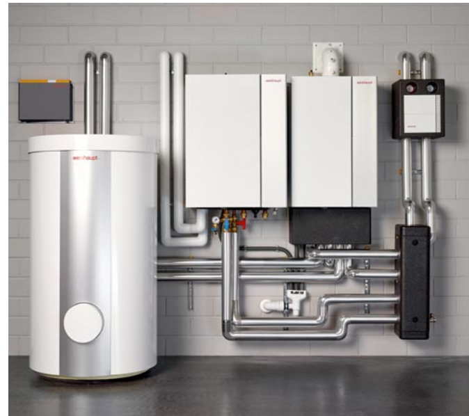
Hybridsystem Wärmepumpe mit Gasbrennwertgerät

Während ein Neubau oder ein Bestandsgebäude mit Fußbodenheizung ideal für die alleinige Beheizung mit einer Wärmepumpe geeignet ist, bietet die Kombination eines Weishaupt Gas-Brennwertgerätes mit einer Weishaupt Wärmepumpe den Vorteil, auch ohne Flächenheizungen den Großteil der Jahresheizarbeit über die Wärmepumpe äußerst wirtschaftlich abzudecken. Bei extrem niedrigen Außentemperaturen oder für die Wassererwärmung übernimmt automatisch das Gas-Brennwertgerät die Wärmeproduktion.