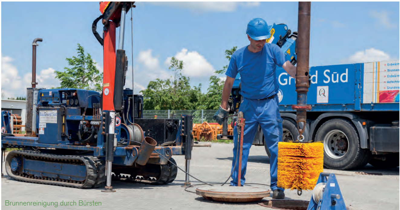
Brunnenreinigung durch Bürsten

Natürliche Alterungserscheinungen an einem Brunnen, wie Verockerung, Versandung oder Verschleimung, führen zu einem Nachlassen des Grundwasserzufflusses. Die Förderleistung (Pumpe) bleibt gleich.