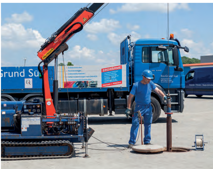
Kolbengerät: Der Kolben wird im Brunnenrohr auf- und abgefahren. Dabei werden Ablagerungen aus dem Ringraum in den Brunneninnenraum gesogen und können mittels Pumpen entfernt werden

In schwierigen Fällen ist der Einsatz geeigneter Chemikalien nicht zu vermeiden. Es kann auch sinnvoll sein, verschiedene Verfahren miteinander zu kombinieren.