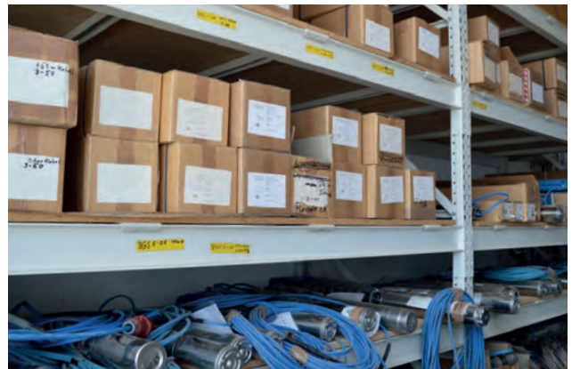
Schnelle Reaktion durch eigenes Pumpenlager