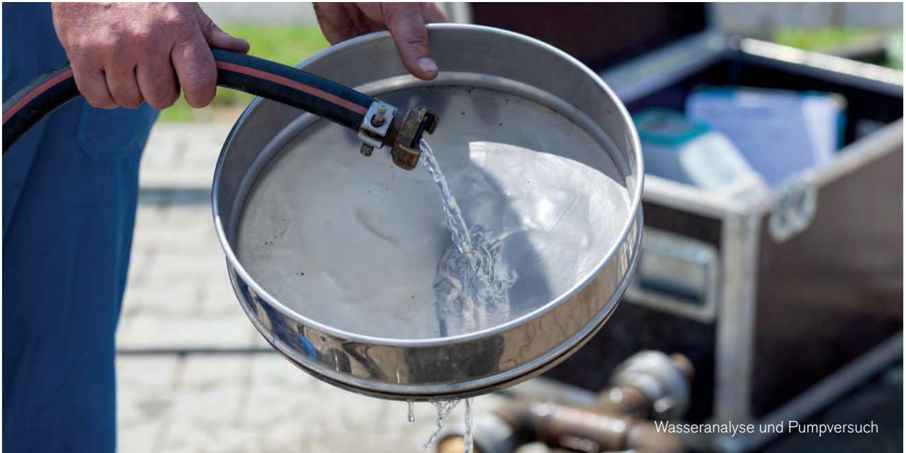
Wasseranalyse und Pumpversuch